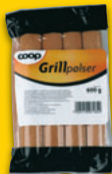
Grillpølser Coop. 600 g. Pr kg 19,83