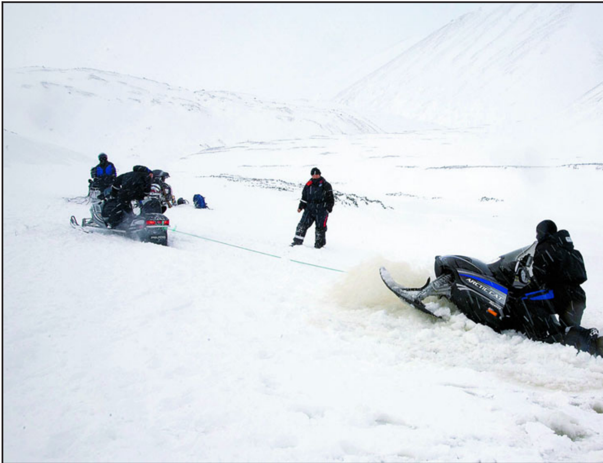
DRAMA: Denne skuteren var en av mange som gikk gjennom isen øverst i Longyeardalen på Svalbard i helgen, men ble berget. Andre gikk til bunns.