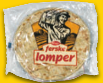
Lomper Berthas. 10 pk. Pr stk 0,56