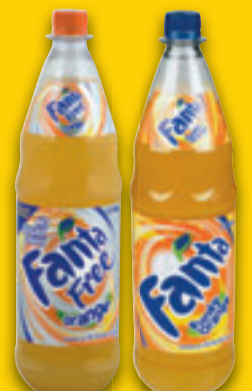
Fanta Orange/Free, 1,5 ltr. Pr ltr 4,60