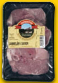
Lammelår i skiver Skjeggerød. Fryst