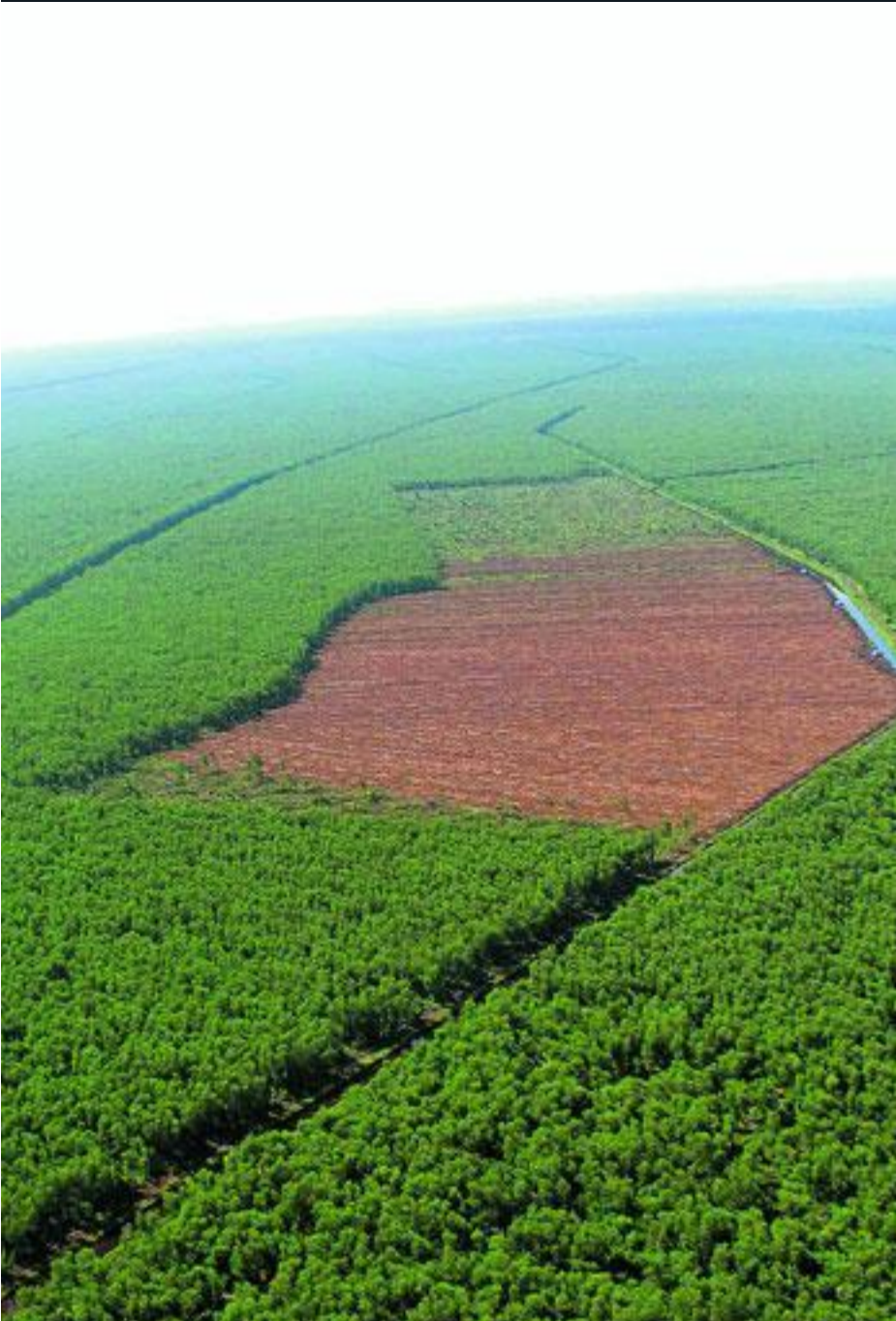
tar opp CO 2 vi slipper ut.