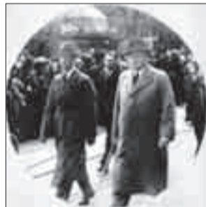
NØKTERN POLITIKAR: Johan Nygaardsvold (til h.) her saman med Einar Gerhardsen.